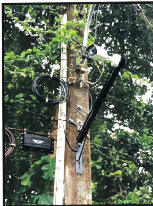
จุดที่ ๓ บริเวณถนนสาย ๓๓๐๐ (ปากทางซอยกรุน ๒)